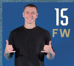
ミッチェル デューク