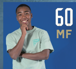
真也加 チュイ 大夢