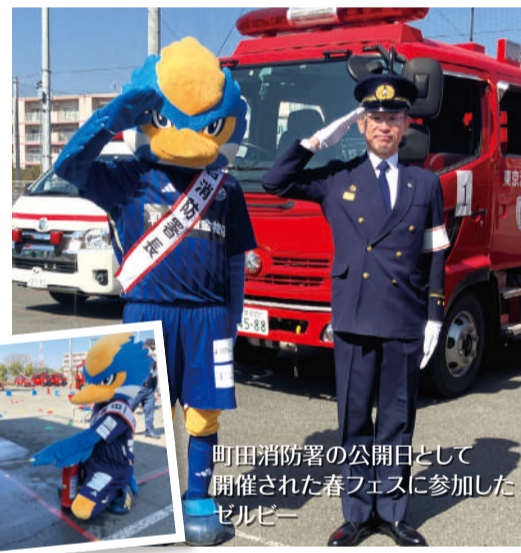
町田消防署の公開日として開催された春フェスに参加したゼルビー

消防に関連する様々なコンテンツが充実しており、来場された皆さんは楽しまれていました。町田消防署長より1日消防署長に任命いただき、タスキをかけてやる気満々のゼルビーは、会場内でグリーティングをしながら参加されている方々と交流させていただきました。