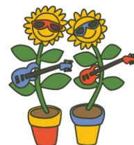
おどるおもちゃ (フラワーロック)