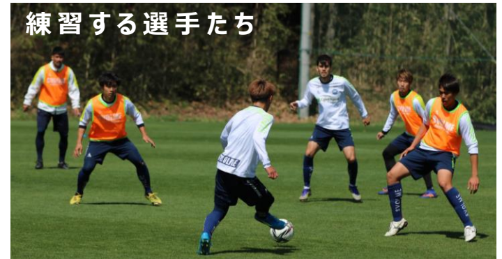
練習する選手たち

「選手全員が練習に参加できる」ということは、 グループに分けたときに 余る人がいないということ だよ！